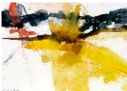
Klaus-Jürgen Wittig, Brixen